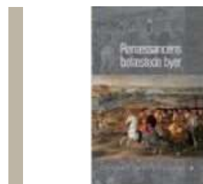
RENÆSSANCENS BEFÆSTEDE BYER