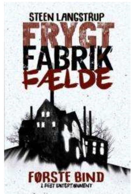
(/boeger/frygt-fabrik-faelde-1-2) FRYGT FABRIK FÆLDE 1-2 (/BOEGER/FRYGT-FABRIK-FAELDE-1-2) Af Steen Langstrup