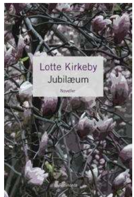
(/boeger/jubilaeum) JUBILÆUM (/BOEGER/JUBILAEUM) Af Lotte Kirkeby Hansen