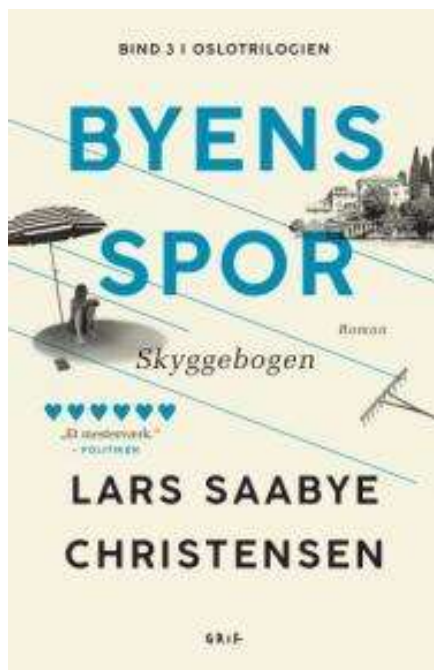
(/boeger/byens-spor-bind-3-skyggebogen-roman) BYENS SPOR. BIND 3: SKYGGEBOGEN (/BOEGER/BYENS-SPOR-BIND-3-SKYGGEBOGEN-ROMAN) Af Lars Saabye Christensen (f. 1953)