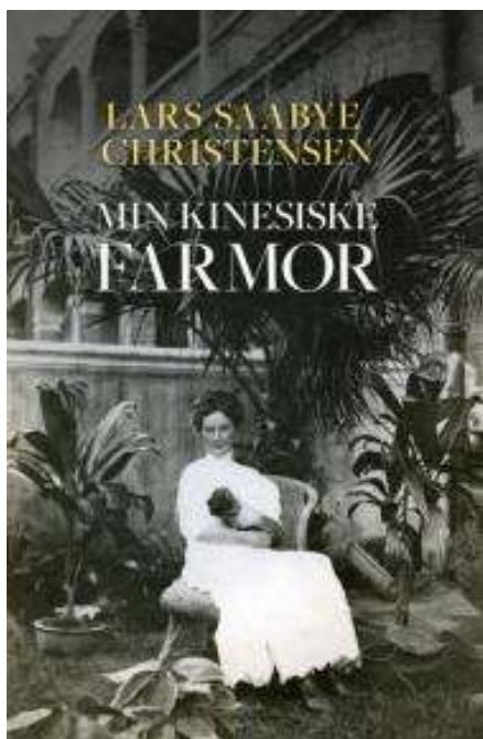
(/boeger/min-kinesiske-farmor) MIN KINESISKE FARMOR (/BOEGER/MIN-KINESISKE-FARMOR) Af Lars Saabye Christensen (f. 1953)