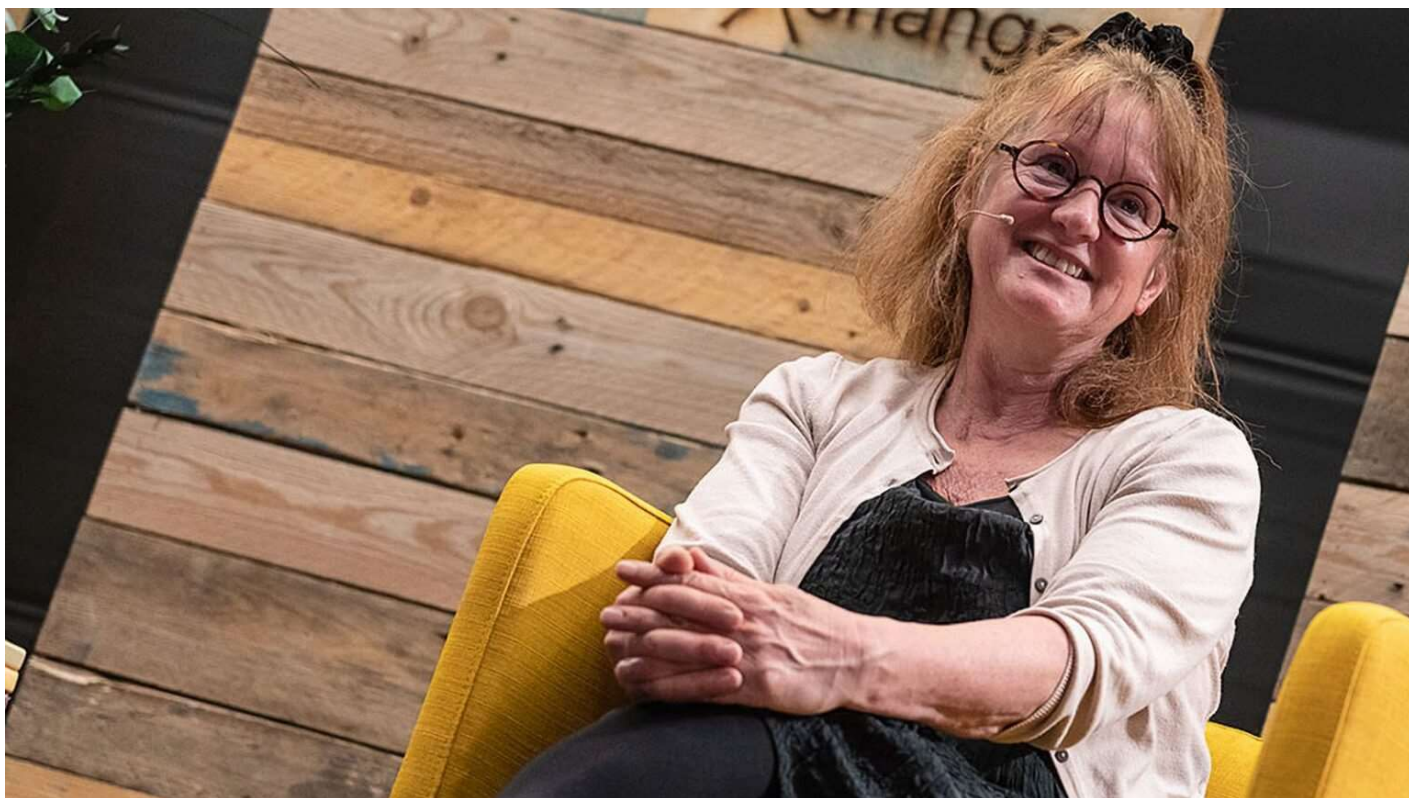
Solvej Balle fotografet i år under en litteraturfestival i Aarhus.

Det burde egentlig være ret uinteressant at følge med i Solvej Balles mange ruminationer over kategoriseringerne. Men det er det ikke. Intet er kedeligt her på den 18. november. Og ja, hvordan gemmer vi egentlig vores viden bedst? Hvordan sikrer vi, at det rigtige både gemmes og kan findes?