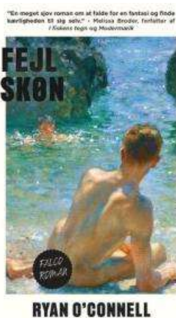
(/boeger/fejlskoen) FEJLSKØN (/BOEGER/FEJLSKOEN) Af Ryan O'Connell