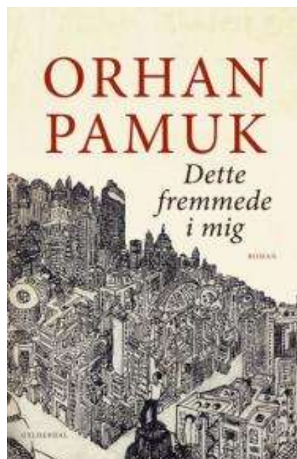
(/boeger/dette-fremmede-i-mig) DETTE FREMMEDE I MIG (/BOEGER/DETTE-FREMMEDE-I-MIG)