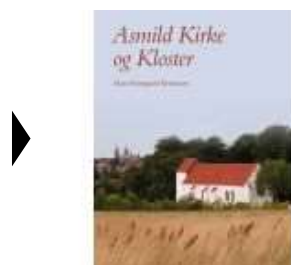
▶ ASMILD KIRKE OG KLOSTER

( https://www.historie-online.dk/boger/anmeldelser-5-5/vikingetid-og-middelalder-13-13-13-13/asmild-kirke-og-kloster ) ( https://www.historie-online.dk/boger/danske-reformationssalmer-i-kontekst )