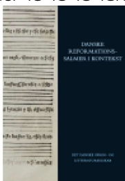
▶ DANSKE REFORMATIONSSALMER I KONTEKST

( https://www.historie-online.dk/boger/anmeldelser-5-5/vikingetid-og-middelalder-13-13-13-13/asmild-kirke-og-kloster ) ( https://www.historie-online.dk/boger/danske-reformationssalmer-i-kontekst )