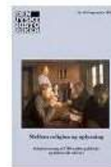
▶ MELLEM RELIGION OG OPLYSNING

( https://www.historie-online.dk/boger/anmeldelser-5-5/kirke-og-religion/mellem-religion-og-oplysning )