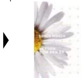
VERDEN SOM DEN ER

( https://www.historie-online.dk/boger/antisemitismens-bibel )