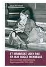
ET MENNESKE UDEN PAS ER IKKE NOGET MENNESKE

( https://www.historie-online.dk/boger/anmeldelser-5-5/diverse-84/verden-som-den-er )