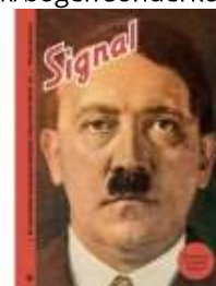
"SIGNAL". SVAR PÅ ANMELDELSE

( https://www.historie-online.dk/boger/sonderkommando )