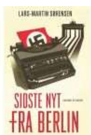
SIDSTE NYT FRA BERLIN

( https://www.historie-online.dk/boger/sidste-nyt-fra-berlin )