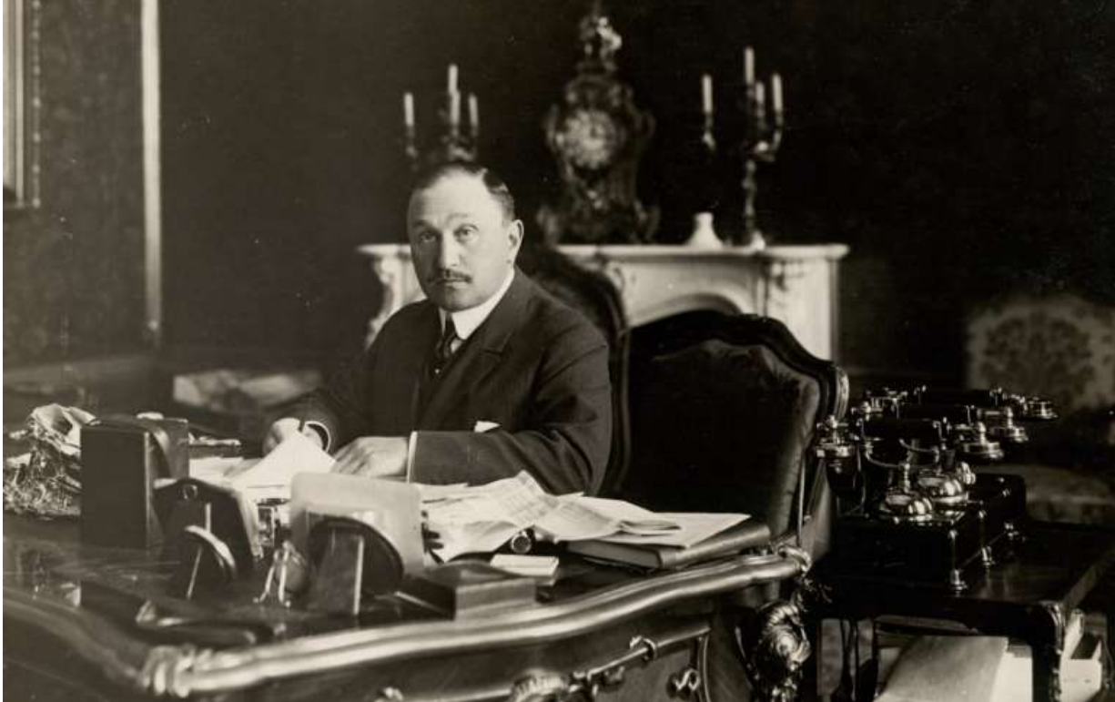
Den store finansmand Emil Glückstadt fotograferet på sit kontor i Landmandsbanken. Læg mærke til de moderne kommunikationsmidler til højre i billedet. Han skulle hele tiden have fingeren på den økonomiske puls.

"Bankdirektøren er overordentlig velhavende. I årene 1914 – 1920 udbetaler Landmandsbanken ham over to millioner kroner i løn og bonusser. Lægger man det sammen med de øvrige indtægter fra bestyrelsesposter og kommissionsarbejde, tjente han fra 1916 godt en million kroner om året. Det svarer til 250 millioner i nutidig købekraft. I 1923 bliver hans formue anslået til 7,3 millioner kroner eller godt 8 millioner kroner i nutidens penge. Men storhed og fald: den 9. marts 1923 "... anmoder undersøgelseskommissionen politikammeret om at sende et par betjente til adressen og bringe Glückstadt i forvaring..." (s.120). Finansfyrsten havner i celle nummer ti i Vestre Fængsel. 23. juni samme år dør han – af tarmslyng. Sensationshungrende københavnere myldrer til de store auktioner med Glückstadtfamiliens rigdomme. Herunder Jens Juels maleri.