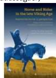
HORSE AND RIDER IN THE LATE VIKING AGE

( https://www.historie-online.dk/boger/anmeldelser-5-5/vikingetid-og-middelalder-13-13-13-13/oldtidsagaer )