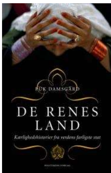
(/boeger/de-renes-land- kaerlighedshistorier-fra-verdens- farligste-stat) DE RENES LAND : KÆRLIGHEDSHISTORIER FRA VERDENS FARLIGSTE STAT (/BOEGER/DE- RENES-LAND-KAERLIGHEDSHISTORIER-FRA- VERDENS-FARLIGSTE-STAT) Af Puk Damsgård