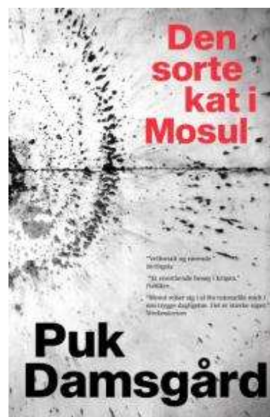
(/boeger/den-sorte-kat-i-mosul) DEN SORTE KAT I MOSUL (/BOEGER/DEN- SORTE-KAT-I-MOSUL) Af Puk Damsgård