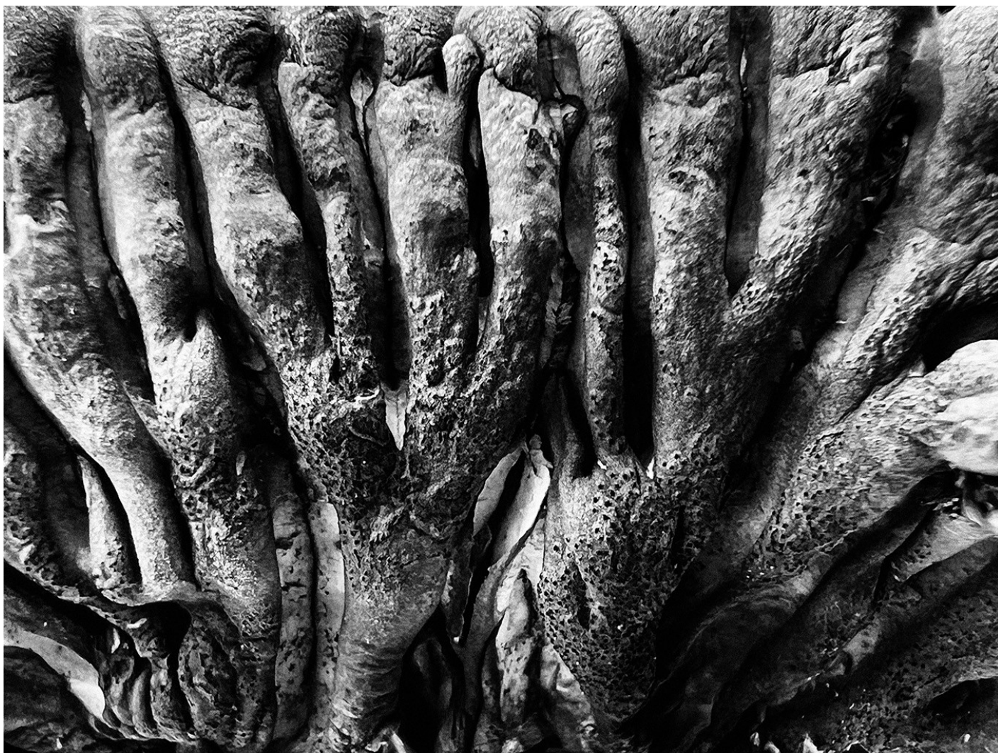
© Lærke Posselt: Jeg vender mig om og ser , 2023

Udgivelsen er/var i øvrigt kombineret med en udstilling af Lærke Posselts billeder og Fauths digte kurateret under titlen Når verden læner sig frem af Victor Meyer Christensen i Norske Hus på Sophienholm. Jeg har i skrivende stund ikke set udstillingen og har anmeldt Jeg vender mig om og ser som sit eget suveræne udtryk, men jeg er sikker på, der er en større ligevægt dér mellem ord og billeder, og Posselts billeder fortjener at blive set i stort format!