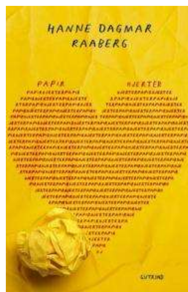
(/boeger/papirhjerter) PAPIRHJETER (/BOEGER/PAPIRHJETER) Af Hanne Dagmar Raaberg