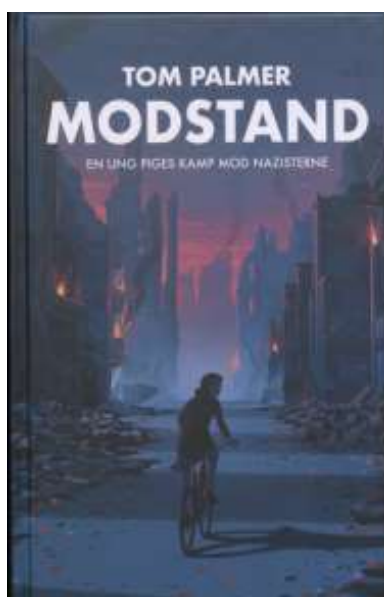
(/boeger/modstand-1) MODSTAND (/BOEGER/MODSTAND-1) Af Tom Palmer (f. 1967)