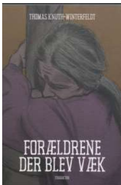
(/boeger/foraeldrene-der-blev-vaek) FORÆLDRENE DER BLEV VÆK (/BOEGER/FORAELDRENE-DER-BLEV-VAEK) Af Thomas Knuth-Winterfeldt