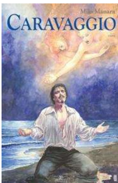
(/boeger/caravaggio-bind-2-naden) CARAVAGGIO. BIND 1 OG 2 (/BOEGER/CARAVAGGIO-BIND-2-NADEN)