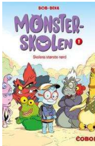
(/boeger/monsterskolen-skolens- stoerste-noerd) MONSTERSKOLEN - SKOLENS STØRSTE NØRD (/BOEGER/MONSTERSKOLEN-SKOLENS- STOERSTE-NOERD) Af Caroline Roque