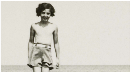
Udsnit af bogens forside.